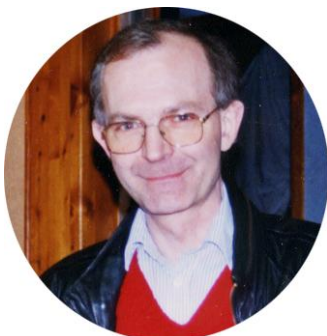
PAR SERGE FERRY F6DZS