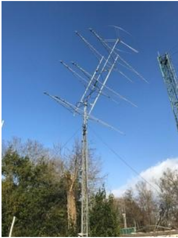
Après le coup de vent

en position basse. Du boulot pour préparer la CDR début juin.