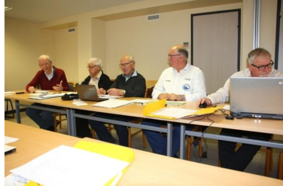
Pendant les débats

Le président lit et commente le rapport moral. Il nous fait également un compte rendu sur les discussions de la table ronde des associations organisée par le REF. Ces discussions portent principalement sur les bandes 5 MHz, 50 MHz et 70 MHz et la défense des bandes. Notre participation a pour but principal d'être représentés par le REF lors des réunions avec l'Administration. Le président nous fait part également de pourparlers avec le laboratoire d'études spatiales et d'instrumentation en astrophysique (LESIA) dont plusieurs chercheurs sont radioamateurs et qui souhaiterait utiliser des fréquences UHF attribuées aux radioamateurs. Lors de sa présence à l'AG du GRAC il a relevé également des difficultés pour les radioamateurs cheminots.