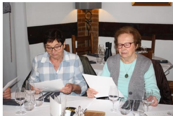
Après l'AG, le choix des plats

Merci de votre participation à cette Assemblée Générale 2017.